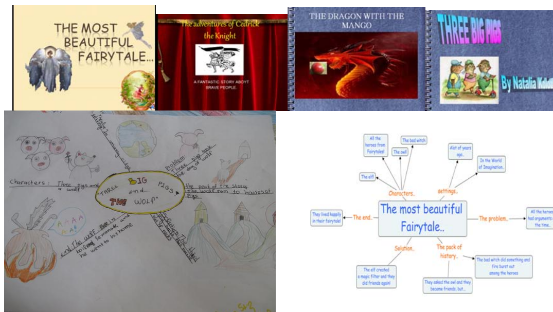
Σχήμα 4: Δείγματα εργασιών των παιδιών

Το στάδιο της ‘αξιολόγησης’ του σχεδίου εργασίας, προσέφερε την ευκαιρία για αναστοχασμό, με τους μαθητές και τον εκπαιδευτικό να συσκέπτονται και να αξιολογούν τόσο τη διαδικασία όσο και το τελικό προϊόν. Αυτή η διαδικασία είχε ως σκοπό να συμβάλλει στη βελτίωση των διδακτικών τεχνικών και ταυτόχρονα να ενισχύει την αυτόνομη μάθηση (Phillips, Burwood and Dunford, 1999). Έτσι, στο συγκεκριμένο σχέδιο εργασίας, η σελίδα της αξιολόγησης της ιστοεξερεύνησης (παράρτημα 1) λειτούργησε σαν πλάνο που έθεσε τα κύρια θέματα της διαδικασίας αξιολόγησης. Η γενική ιδέα στο τέλος όλης της διαδικασίας ήταν ότι οι μαθητές ευχαριστήθηκαν που δημιούργησαν κάτι δικό τους, ένιωσαν ικανοποίηση και αυτοπεποίθηση. Χαρακτήρισαν την ιστοεξερεύνηση μια πολύ ευχάριστη εμπειρία και πρότειναν να δραματοποιήσουν τα έργα τους. Στο τέλος, εκτός από τη δημοσίευση όλων των έργων στο wiki, προέκυψαν διαγράμματα, πόστερς στην τάξη, ζωγραφιές και μικρά θεατρικά που παρουσιάστηκαν στο τέλος της σχολικής χρονιάς. Επίσης, δημιουργήθηκε ένα περιοδικό με παραμύθια που μοιράστηκε στα παιδιά (σχ. 4 και παράρτημα 4: αποσπάσματα της δουλειάς των παιδιών).