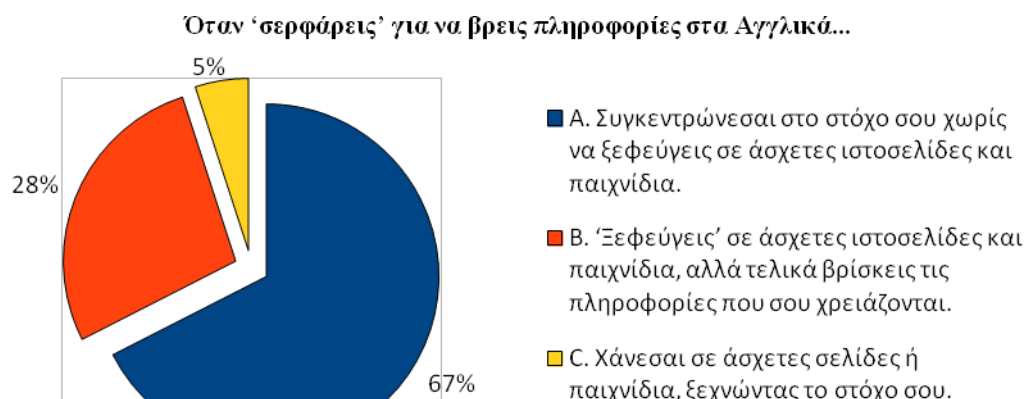
Σχήμα 1: Πόσο συγκεντρωμένοι στο στόχο τους είναι οι μαθητές όταν 'σερφάρουν' στο διαδίκτυο για μια εργασία;

τα ενδιαφέροντά τους σε σχέση με το διάβασμα. Φάνηκε ότι ένα ποσοστό μαθητών (28%) 'ξεφεύγουν' σε άσχετες ιστοσελίδες αλλά στο τέλος βρίσκουν τις πληροφορίες που τους χρειάζονται, ενώ ένα 5%, χάνονται ξεχνώντας το στόχο τους (σχ. 1).