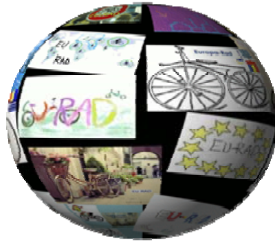
Σχήμα 2: Λογότυπο με χρήση εργαλείων κολάζ kizoa, και επεξεργασίας φωτογραφιών GIMP.

Δημιουργία κοινού λογότυπου με χρήση εργαλείων επεξεργασίας φωτογραφιών (GIMP) και κολάζ με το διαδικτυακό εργαλείο KIZOA.