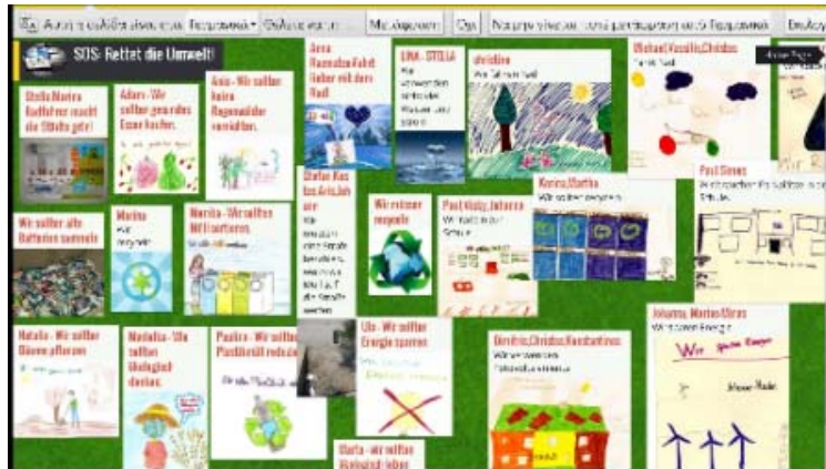
Σχήμα 5: Ζωγραφιές αναρτημένες στον ηλεκτρονικό πίνακα κοινής χρήσης padlet: Θέμα: «ΣΟΣ. Σώστε το περιβάλλον».