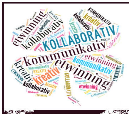
Σχήμα 4: Αφίσα με χρήση διαδικτυακού εργαλείου tagxedo. Αξιολόγηση του προγράμματος.

Αξιολόγηση του προγράμματος με κοινές δράσεις (δενδροφύτευση, αισθητική παρέμβαση στους τοίχους του σχολείου μας), χρήση ερωτηματολογίου αξιολόγησης στο blog της συνεργατικής πλατφόρμας twinspace και ανάρτηση ζωγραφιών και εργασιών με διαδικτυακά εργαλεία tagxedo rizar (όπως εμφανίζεται στο Σχήμα 4), στον κοινό ηλεκτρονικό πίνακα, radlet (όπως εμφανίζεται στο Σχήμα 5).