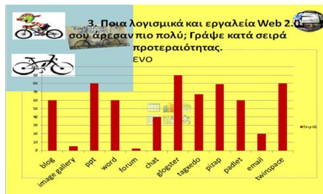
Σχήμα 7: Αποτελέσματα από το ερωτηματολόγιο αξιολόγησης, ερώτηση 3

Επίσης στην ερώτηση «ποια λογισμικά και διαδικτυακά εργαλεία σου άρεσαν πιο πολύ» οι περισσότεροι μαθητές βρήκαν το glogster πιο ενδιαφέρον (90%) και το 80% το PPT, το twinspace και το pizar. Το tagxedo, το radlet, το blog και το word βρίσκονται στην τρίτη θέση με 60% συμμετοχή, ενώ το forum και η image gallery βρίσκονται στη τελευταία θέση με 3%. Από τις απαντήσεις των μαθητών συμπεραίνουμε ότι οι μαθητές ενδιαφέρονται για τα διαδικτυακά εργαλεία Web 2.0 διότι από τη μια αποτελούν μέσο για να φτιάξουν δημιουργικές συνεργατικές εργασίες και δεύτερον αποτελούν μέσο διαμοιρασμού ιδεών και πολιτισμών.