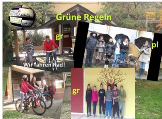
Σχήμα 3: Παρουσίαση της δράσης: Οι πράσινοι κανόνες, φωτογραφίες από το βίντεο σε παρουσίαση PPT, αναρτημένη στην ηλεκτρονική πλατφόρμα twinspace.

Δημιουργία κοινού βίντεο με θέμα: οι πράσινοι κανόνες στην καθημερινότητα μας και στο σχολείο, χρήση εργαλείων για παραγωγή βίντεο (moviemaker), ανάρτηση υλικού στο διαδίκτυο, στον ηλεκτρονικό πίνακα κοινής χρήσης radlet και στην πλατφόρμα συνεργασίας twinspace.