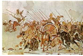
Σχήμα 4: Μάχη στην Ισσό 4