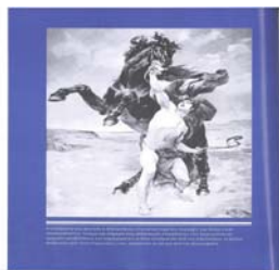
Σχήμα 1: Αλέξανδρος και Βουκεφάλας 1

Στη διδασκαλία μας χρησιμοποιήσαμε περίπου είκοσι εικόνες και μέσω ενός επικοινωνιακού διαλόγου προσπαθήσαμε να πετύχουμε στους στόχους μας. Εδώ έχουμε ένα μικρό δείγμα κάποιων εικόνων που χρησιμοποιήθηκαν στην διαδικασία της διδασκαλίας μας (Σχήμα 1,2,3,4,5,6).