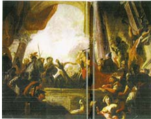
Σχήμα 5: Γόρδιος δεσμός 5