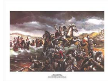
Σχήμα 6: Ο Μέγας Αλέξανδρος στη μάχη του Γρανικού ποταμού, 334 π.Χ. 6

Με την προβολή κάθε εικόνας γινόταν συζήτηση με τους μαθητές για το ιστορικό γεγονός που παρουσίαζε οικοδομώντας με τον τρόπο αυτό την ιστορική γνώση. Παράλληλα εντάσσαμε στη διδασκαλία και κάποια βίντεο που παρακολούθησαν τα παιδιά (πατώντας μόνο τους στο διαδίκτυο τις ηλεκτρονικές διευθύνσεις που τους είχαν δοθεί σε κειμενογράφο - word) σχετικά με το Μέγα Αλέξανδρο ενταγμένα κάθε φορά στη σωστή χρονική αλληλουχία.