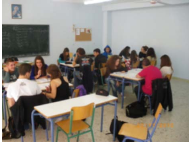
Σχήμα 2: Φωτογραφία από τη μελέτη των κειμένων σε ομάδες στην αίθουσα διδασκαλίας

Τα πρώτα σχόλια από την πλευρά των μαθητών αφορούσαν τον όγκο των σελίδων των προς ανάγνωση κειμένων. Οι ομάδες που είχαν να διαβάσουν διηγήματα παρατήρησαν πως οι σελίδες που έλαβαν ήταν πολύ περισσότερες από τους υπόλοιπους και παραπονέθηκαν στον εκπαιδευτικό. Υπήρξαν, επίσης, πολλές απορίες για το τι έπρεπε να κάνουν ακριβώς, επιμένοντας, κυρίως οι ομάδες που ασχολούνταν με τα δημοτικά τραγούδια, ότι δεν ήταν εύκολο να κατανοήσουν όσα έπρεπε να μελετήσουν. Οι περισσότερες απορίες διατυπώθηκαν για τα κείμενα του Παπαδιαμάντη. Έγιναν ερωτήσεις που αφορούσαν τη γλώσσα του κειμένου που δυσκόλεψε τους μαθητές.